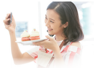
SNSでの街の魅力発信