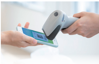
キャッシュレス決済活用による 利便性向上