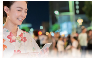
町おこしイベントでの活用