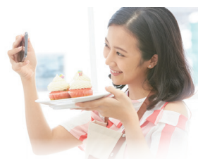
SNSでの街の魅力発信