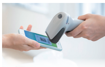
キャッシュレス決済活用による 利便性向上