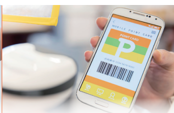
電子クーポンやデジタルポイント カード、WEBチラシの活用