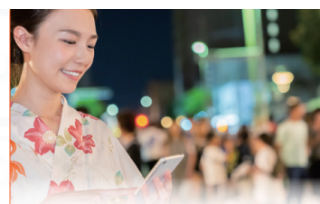
町おこしイベントでの活用