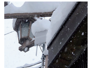
2020年12月の降雪時でも安定稼働する「WAPM-1266WDPRA」

国分寺通り商店街は、手間なく利用できる公衆Wi-Fiエリアを拡大し、より観光が楽しめる街へ進化を遂げました。