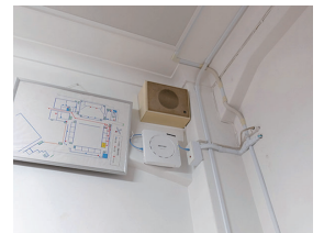
教室に設置された、Wi-Fi 6(11ax)対応の無線LAN機器「WAPM-AX8R」。

が、この環境をどう活用し、どんな授業を展開するのか楽しみにしています」と話してくれました。