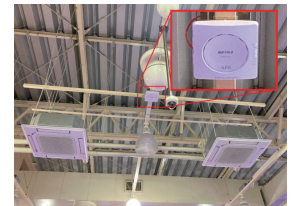
店舗には、最新規格Wi-Fi 6(11ax)対応の「WAPM-AX8R」を選定。

本社のWi-Fi整備によりLANケーブル携帯の煩わしさから社員を解放。またWi-Fi 6(11ax)を提供する店舗では「Wi-Fiがつかない」という声は無くなり、快適なWi-Fi提供による集客効果も期待されます。