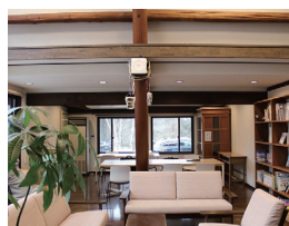
施設内全域をカバーできるよう適所に「WAPM-AX8R」を設置

施設内と同等の環境を条件に「WAPM-AX4R」と屋外用アンテナ「WLE-HG-DA/AG」を組み合わせることで屋外にWi-Fi 6(11ax)を提供。施設内外をシームレスにつなぎ、快適にWi-Fi通信できる環境を構築しました。