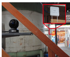
工場内でネットワークカメラを活用するために「WAPM-1266R」を設置

調査により「WAPM-1266R」11台で敷地全域をカバーするWi-Fiを構築できるとわかり、BITSが施工を実施しました。業務を止めることのないよう、施工は2日間で完了しました。