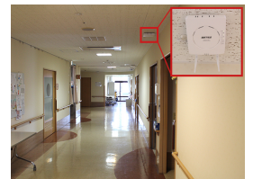
約60台の「WAPM-AX4R」を設置し、より高速通信可能なインフラを構築

アラート通知時にはインカムに部屋番号が自動で流れるため即時対応も可能。また、全職員での朝礼を廃止し、インカムで連絡事項を伝達する体制に変更。その時間を入居者へのケアに充てられるようになりました。