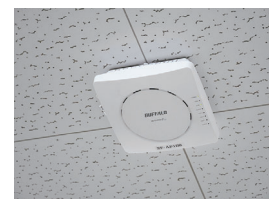
高等学校職員室の天井に設置された、高速・大容量通信規格Wi-Fi 6(11ax)対応の「WAPM-AX8R」

法人向けNAS「TS6400RN0804」の導入により、散逸していた教材や校務関係のデータを一元管理し、利用できる環境が整いました。ICT基盤の強化は教室へと計画が進んでおり、教員と生徒間の新たな学習形態が多く作られることへ期待が寄せられています。