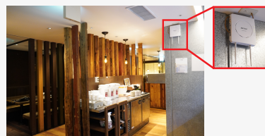
「WAPM-AX4R」を用いて店内全域の通信をカバー

180店舗に高速通信規格Wi-Fi 6(11ax)対応の「WAPM-AX4R」を導入。店舗の平均的な広さは約115坪30席。基本的に1店舗1台で店内の全域をカバーしている。